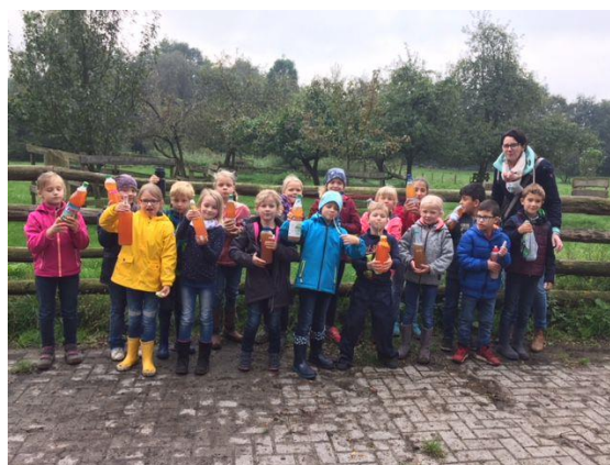
Bild: Stolz präsentieren die Schülerinnen und Schüler der Kroger Grundschule ihren selbst gepressten Apfelsaft

Die zerkleinerten Äpfel wurden schließlich in die Obstpresse gegeben. Nun war Muskelkraft gefragt. Durch ständiges drehen wurden die Äpfel ausgepresst und der leckere Apfelsaft direkt verkostet.