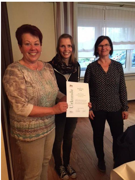
Bild: Übergabe der Urkunde beim Partnerschultreffen