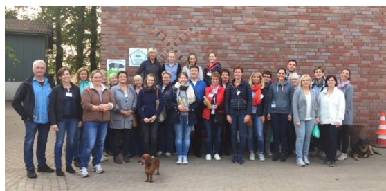
Bild: Die TeilnehmerInnen des 9. Partnerschultreffens

Neben den vielen Informationen wurde aber auch handlungsorientiert gearbeitet. Der andere Teil der Gruppe hat aus den hofeigenen Äpfeln, die nicht als Tafelobst verkauft werden können, Apfelsaft gepresst und verkostet.